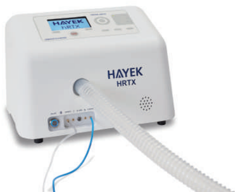
Hayek HRTX pro domácí péči

pediatrický adaptér k úzké hadici ke kyrysu