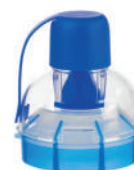
Vortex náhradní náustek