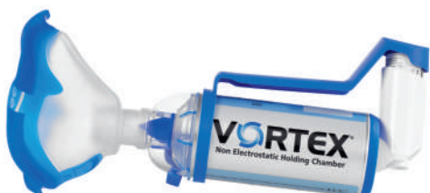
Vortex s náustkem pro dospělé