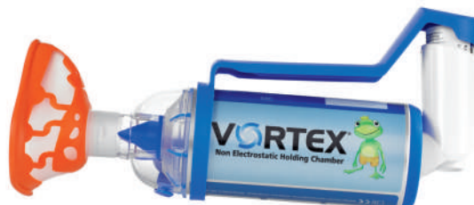
Vortex s MDI dávkovačem