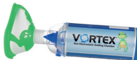
Vortex s maskou pro děti od 2 let