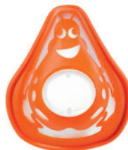
Dětská maska (0-2 roky)