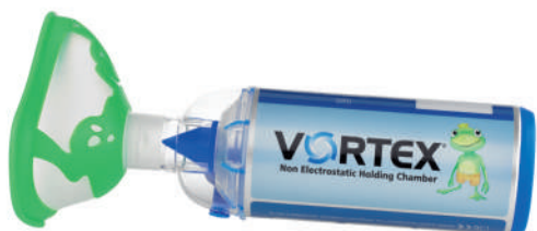
Vortex s maskou pro děti od 2 let

Pro všechny typy běžných aerosolových dávkovačů (MDI).