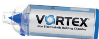
Vortex s náustkem