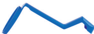
Vortex nástavec pro MDI dávkovač