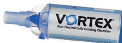
Vortex pro pacienty s tracheostomií