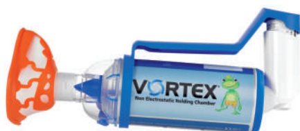
Vortex s maskou pro děti (0 - 2 roky)