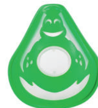
Dětská maska (od 2 let)